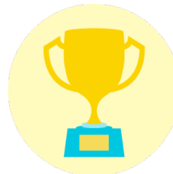
Best in class