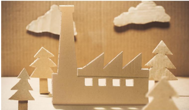
Innovazione circolare La finanza sostenibile e la filiera di carta e cartone