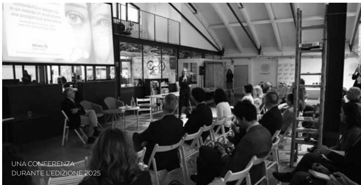
UNA CONFERENZA DURANTE L'EDIZIONE 2025

assicuratrici: la pressoché totalità (99,7%) include i criteri ESG nelle proprie politiche di investimento e li applica a una porzione del portafoglio compresa tra il 75 e il 100%. Le analisi del Morgan Stanley Institute for Sustainable Investing del 2024 confermano queste tendenze, dimostrando come l'interesse degli investitori sia rimasto molto elevato: l'88% degli investitori individuali globali si dichiara propenso a scegliere prodotti sostenibili, mentre tra i più giovani questa percentuale sfiora la totalità (99% della Generazione Z e 97% dei Millennials).